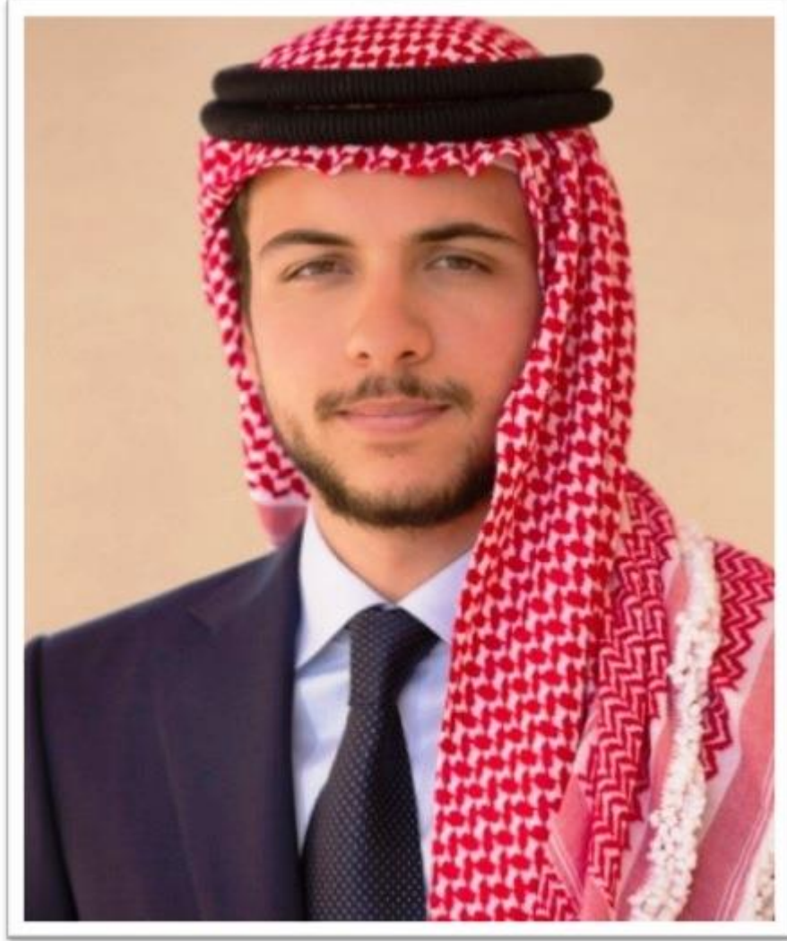
صاحب السمو الملكي الأمير الحسين بن عبد الله الثاني – ولي العهد المعظم

"لا بد من تحقيق طموح الشباب من خلال تحصينهم بالتعليم النوعي وفرص العمل المناسبة".